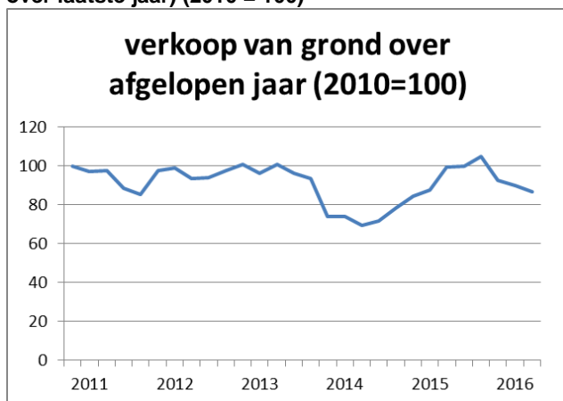
Figuur 1 Index verkoopopbrengst gemeentelijke bouwgrond (voortschrijdende kwartaalopbrengsten gemeten over laatste jaar) (2010 = 100)