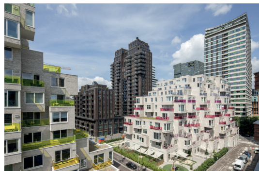
Summertime, 171 middenhuurwoningen, Amsterdam

Het tekort aan middenhuurwoningen in Nederland is sinds de wederopbouw na de Tweede Wereldoorlog ontstaan, omdat toen vanuit de overheid zwaar werd ingezet op eigen woningbezit (via de hypotheekrenteaftrek) en sociale huur (via woningcorporaties). De koop- en sociale huurwoningvoorraad zijn hierdoor de afgelopen decennia enorm toegenomen, ten koste van de middenhuurvoorraad. Omdat woningcorporaties sinds een paar jaar passend moeten toewijzen aan lagere inkomens, de prijzen van koopwoningen in veel steden enorm hard zijn gestegen en de hypotheeknormen steeds verder worden aangescherpt, is een groeiende doelgroep aangewezen op de middenhuur. De flexibilisering van de maatschappij draagt hier ook aan bij: huren wordt steeds populairder. De vraag naar middenhuur groeit harder dan het aanbod kan bijbenen, waardoor er nu een kwantitatief en kwalitatief tekort is.