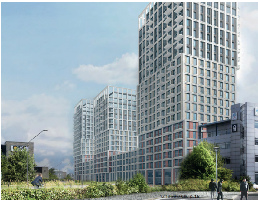
Het Dok, 314 middenhuurwoningen, NDSM-terrein, Amsterdam

Nederland heeft een groot tekort aan middenhuurwoningen, vooral in stedelijke gebieden. Bouwinvest wil bijdragen aan de oplossing. Voor onze bestaande portefeuille nemen wij maatregelen om de woningen bereikbaar te houden. Maar uiteindelijk is het toevoegen van veel extra woningen in alle segmenten de enige oplossing om de betaalbaarheid structureel op te lossen. Om dit te bereiken is het volgens Bouwinvest nodig dat alle betrokken partijen op alle niveaus samenwerken en soms bereid zijn concessies te doen. Alleen als gemeenten, woningcorporaties, institutionele beleggers en projectontwikkelaars bereid zijn de handen ineen te slaan, kan er een structurele oplossing komen voor het nijpend tekort aan dit segment huurwoningen in stedelijke gebieden.